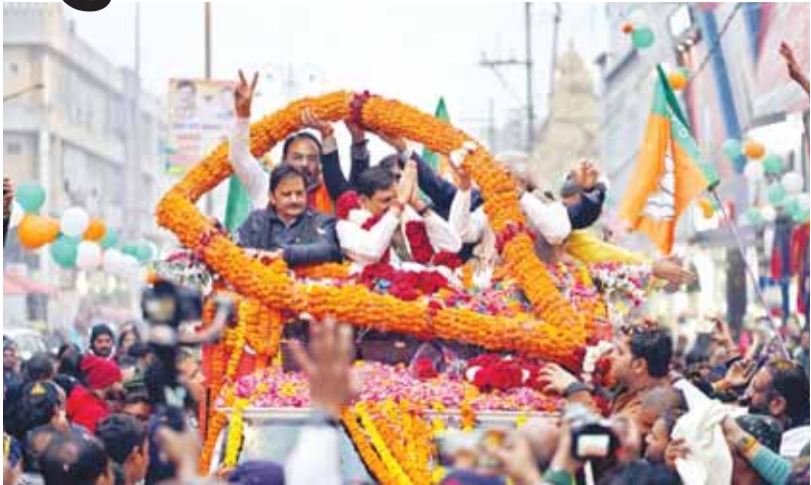
मुख्यमंत्री डॉ यादव का रीवा की जनता ने पुष्प वर्षा करके किया अभिनंदन