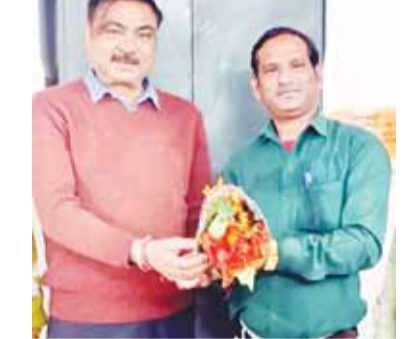
निर्देश एवं मार्गदर्शन के लिए जिला क्षय